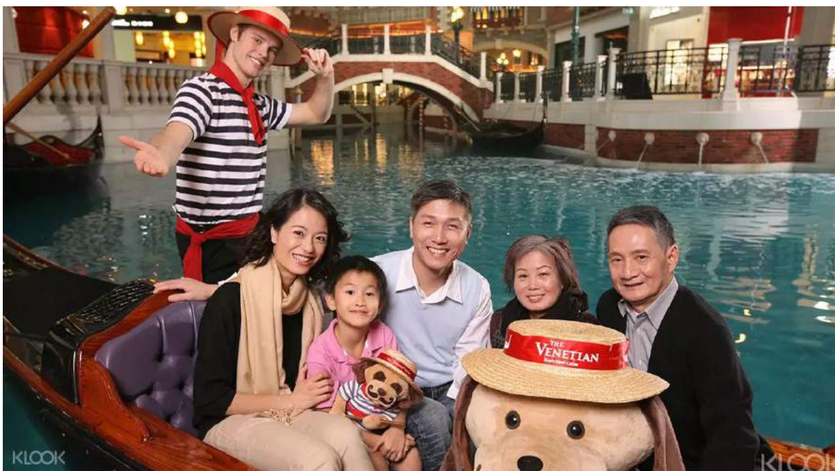
Gondola ala Venice di The Venetian Macau | Image credit: Klook

Di Macau, kamu bisa mengunjungi beragam objek wisata peninggalan bersejarah Portugis seperti Ruins of St. Paul's, Senado Square dan Benteng Guia. Selama berada di kota yang dijuluki sebagai "Las Vegas-nya Asia" ini, sempatkan juga untuk mengunjungi kasino dan pusat hiburannya yang terkenal.