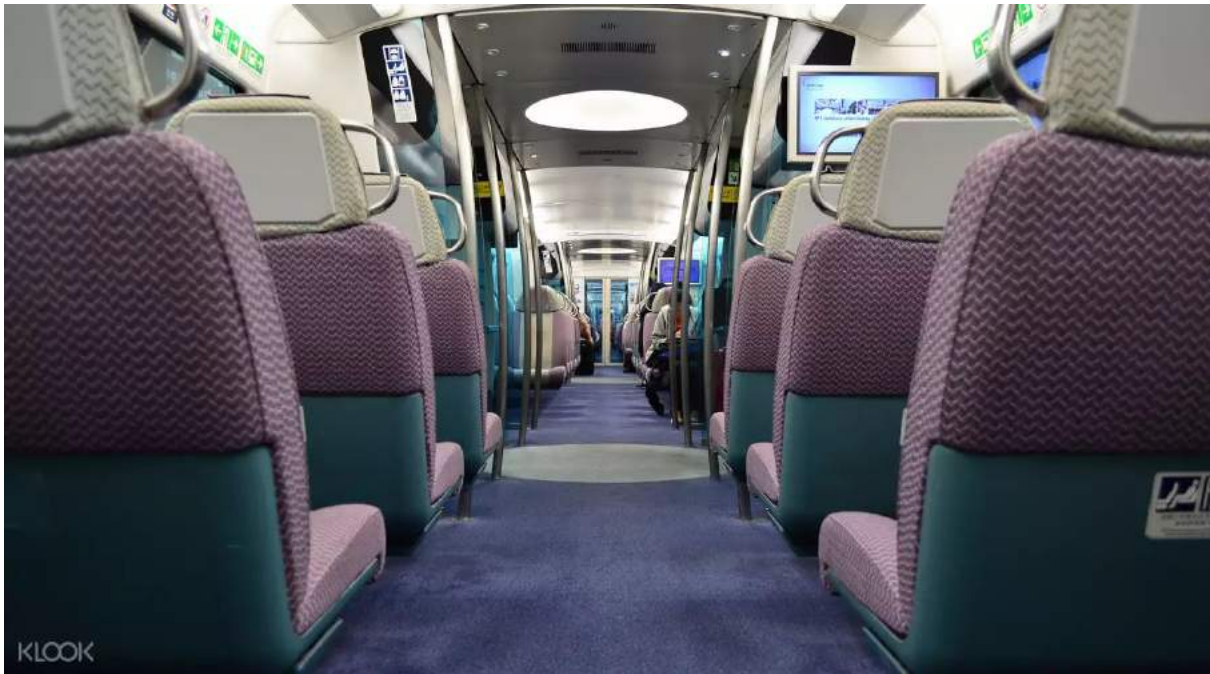
Hong Kong Express Train

Klook Pro-Tip: Gunakan Hong Kong Express Train , mode transportasi paling nyaman, murah dan cepat untuk menuju ke pusat kota dari Bandara Internasional Hong Kong. Selain menghemat hingga 30 HKD (~Rp 53.200) , kamu tidak perlu menukarkan tiket fisik dan cukup menggunakan QR code yang kamu dapatkan dari Klook untuk menaiki kereta ini . Praktis banget!