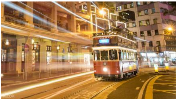
Kereta trem Hong Kong

Mode transportasi umum utama di Hong Kong adalah Mass Transit Railway (MTR) . Sistem kereta MTR ini menghubungkan 4 distrik utama kota Hong Kong yaitu Hong Kong Island, Kowloon Peninsula, New Territories dan Lantau Island. Biaya transportasi dengan menggunakan kereta MTR juga cukup terjangkau dengan harga berkisar antara 5 – 50 HKD (~Rp 3.500 – 89.000) untuk sekali jalan.