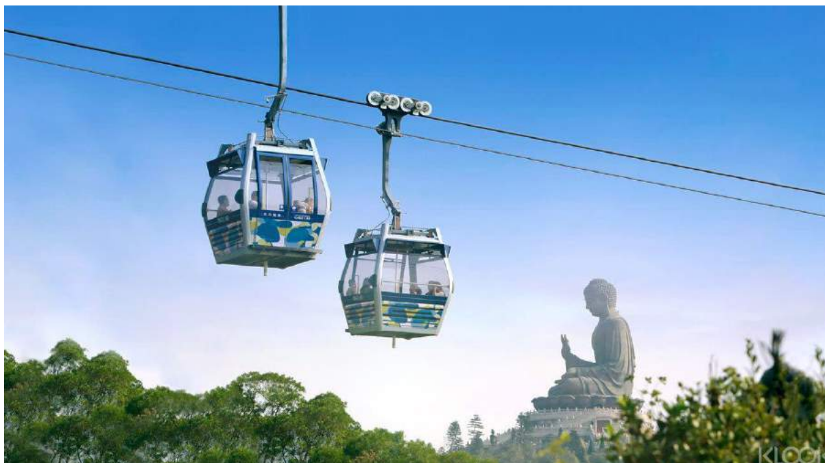
Ngong Ping | Image credit: Klook

Saat berada di Hong Kong, sempatkan waktu untuk mengunjungi Ngong Ping di Lantau Island. Kamu bisa menikmati pemandangan alam sekaligus mempelajari kebudayaan Hong Kong di sini. Beberapa objek wisata di area bukit Ngong Ping yang asri adalah patung Buddha Tian Tan, Biara Po Lin, Desa Ngong Ping dan Piazza Ngong Ping.