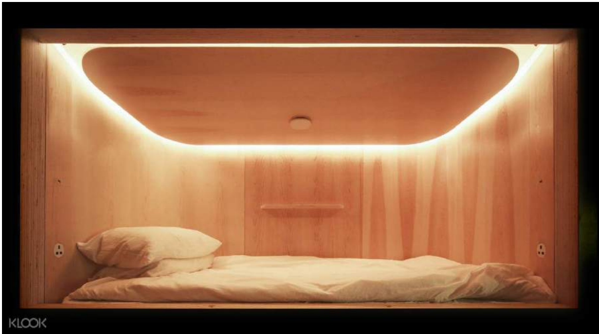
Salah satu hotel kapsul di Hong Kong

Untuk menginap di hotel berbintang tiga dengan kamar yang berukuran relatif kecil saja, kamu harus siap mengeluarkan biaya sekitar 500 hingga 700 HKD (~Rp 886.000 hingga Rp 1.240.000) per malam. Kalau mau menghemat, kamu sebaiknya memilih alternatif akomodasi lain yang lebih murah seperti hostel dan Airbnb. Harga kamar hostel berkisar antara 150 hingga 350 HKD (~Rp 266.000 hingga Rp 620.000) sedangkan Airbnb tipe kamar pribadi untuk 2 orang memasang tarif seharga 250 hingga 350 HKD (~Rp 443.000 hingga Rp 620.000) per malam.