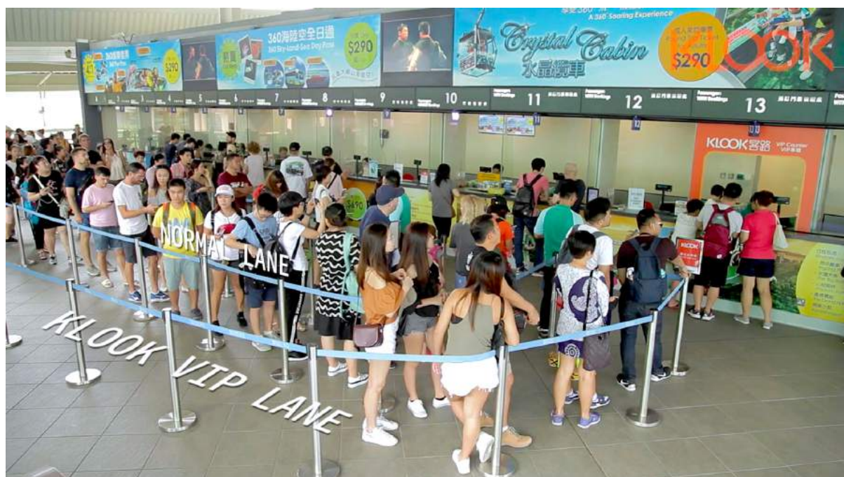
Jalur VIP Klook di Ngong Ping | Image credit: Klook

Saat berada di Hong Kong, sempatkan waktu untuk mengunjungi Ngong Ping di Lantau Island. Kamu bisa menikmati pemandangan alam sekaligus mempelajari kebudayaan Hong Kong di sini. Beberapa objek wisata di area bukit Ngong Ping yang asri adalah patung Buddha Tian Tan, Biara Po Lin, Desa Ngong Ping dan Piazza Ngong Ping.