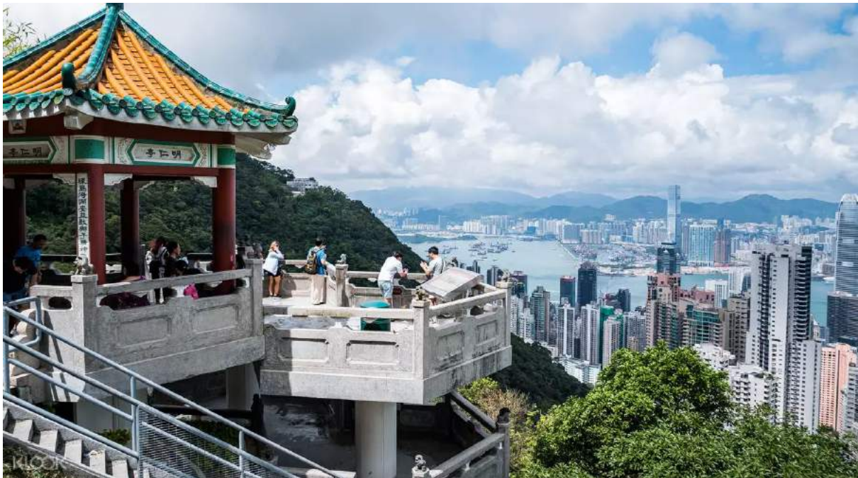
Pemandangan Hong Kong dari Victoria Peak

Sebagai salah satu destinasi wisata favorit turis mancanegara, Hong Kong memiliki beragam objek wisata yang bisa kamu kunjungi mulai dari wisata alam, belanja, kuliner, seni hingga theme park !