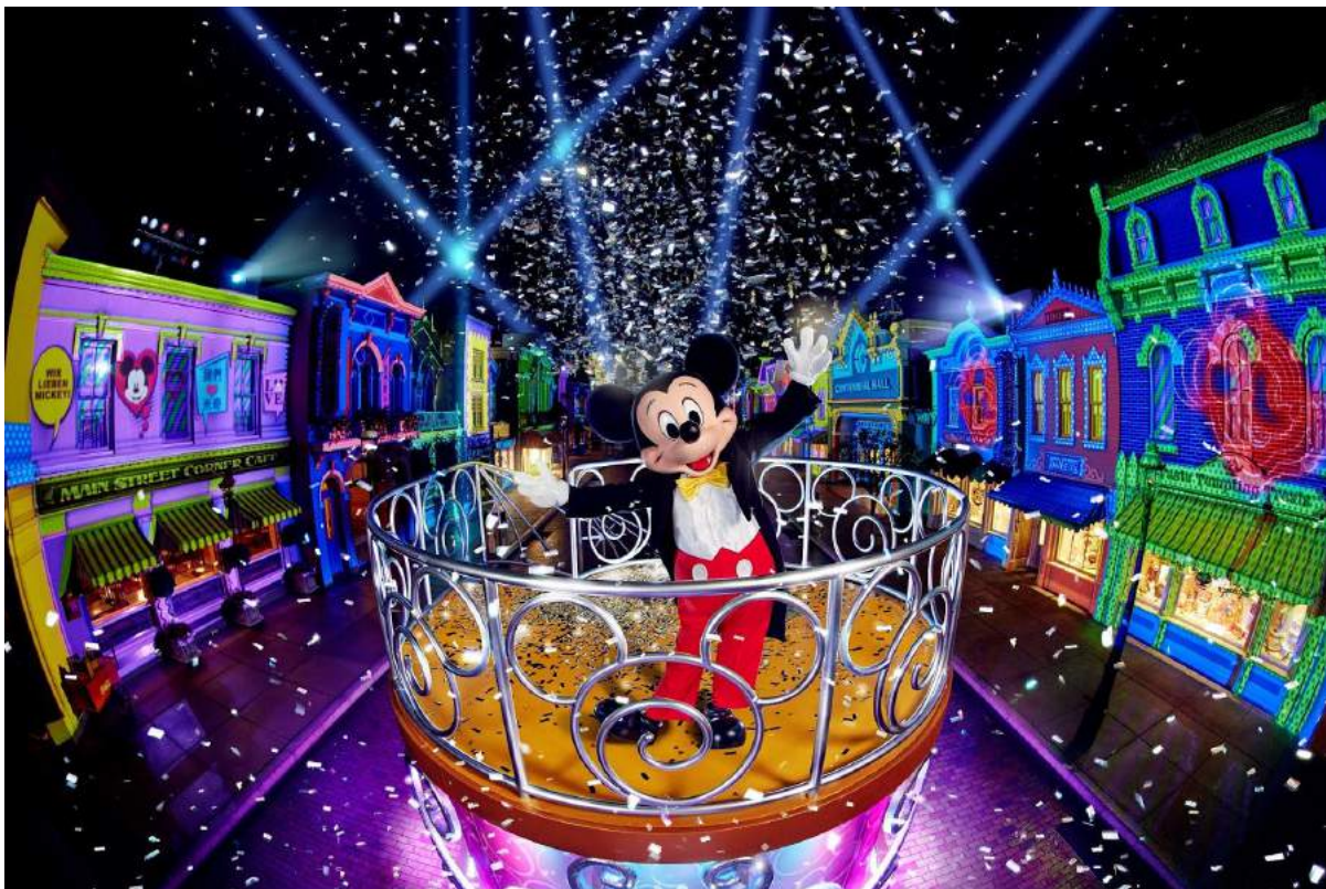
Hong Kong Disneyland | Image credit: Klook

27.000). Selain itu, kamu bisa melewati jalur VIP Klook dan tidak perlu antri panjang untuk menaiki cable car saat membeli tiket Ngong Ping 360 melalui Klook!