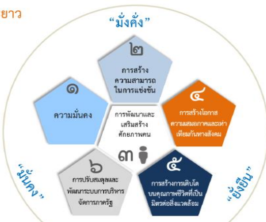
ความเชื่อมโยงของยุทธศาสตร์ชาติกับแผนในระดับต่างๆ

เพื่อให้บรรลุวิสัยทัศน์ “ประเทศไทยมีความมั่นคง มั่งคั่ง ยั่งยืน เป็นประเทศพัฒนาแล้ว ด้วยการพัฒนาตามปรัชญาของเศรษฐกิจพอเพียง” นำไปสู่การพัฒนาให้คนไทยมีความสุข และตอบสนองต่อการบรรลุ ซึ่งผลประโยชน์แห่งชาติ ในการที่จะพัฒนาคุณภาพชีวิต สร้างรายได้ระดับสูงเป็นประเทศพัฒนาแล้ว และสร้างความสุขของคนไทย สังคมมีความมั่นคง เสมอภาคและเป็นธรรม ประเทศสามารถแข่งขันได้ในระบบเศรษฐกิจ