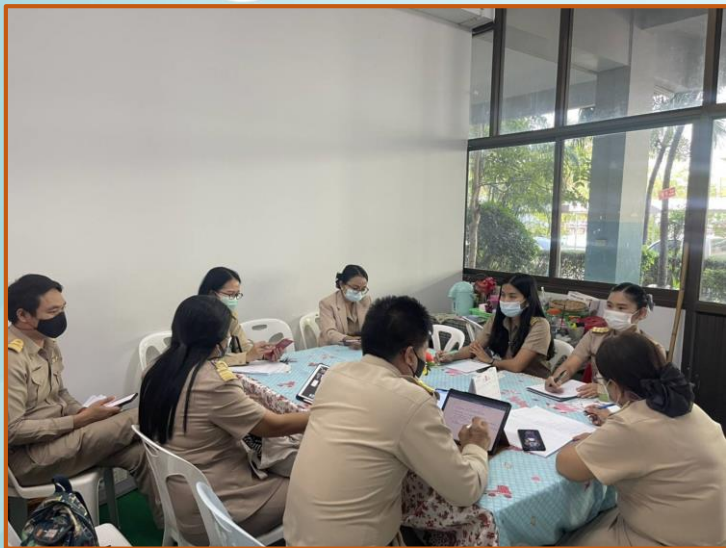
ร่วมกิจกรรมแห่งการเรียนรู้ทางวิชาชีพ (PLC) ฝ่ายวิชาการ