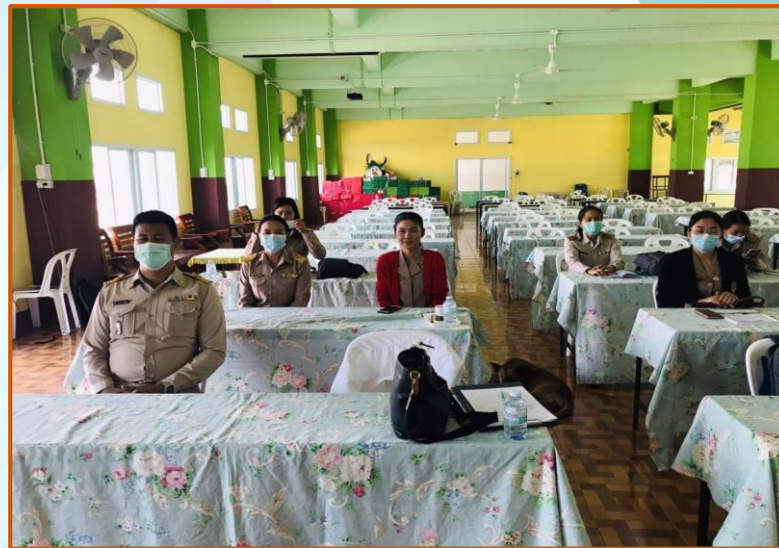
เข้าร่วมการประชุมชี้แจงแนวปฏิบัติโครงการโรงเรียนคุณภาพ วิทยาศาสตร์ คณิตศาสตร์ และเทคโนโลยี ตามมาตรฐาน สสวท.