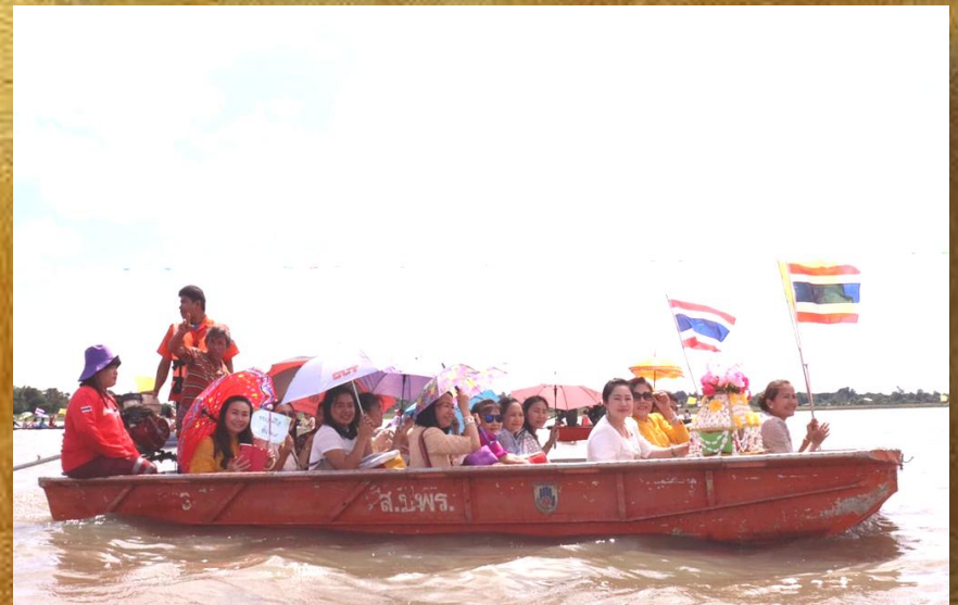
งานทอดผ้าป่าทางน้ำ เกาะโนนข่า อ่างห้วยค้อ อ.นาเชือก