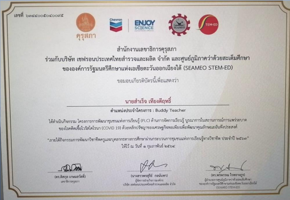
อบรมการจัดการเรียนการสอนทางไกล ในสถานการณ์ COVID-19