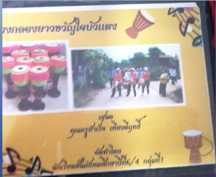
นำเสนอผลงานของนักเรียน