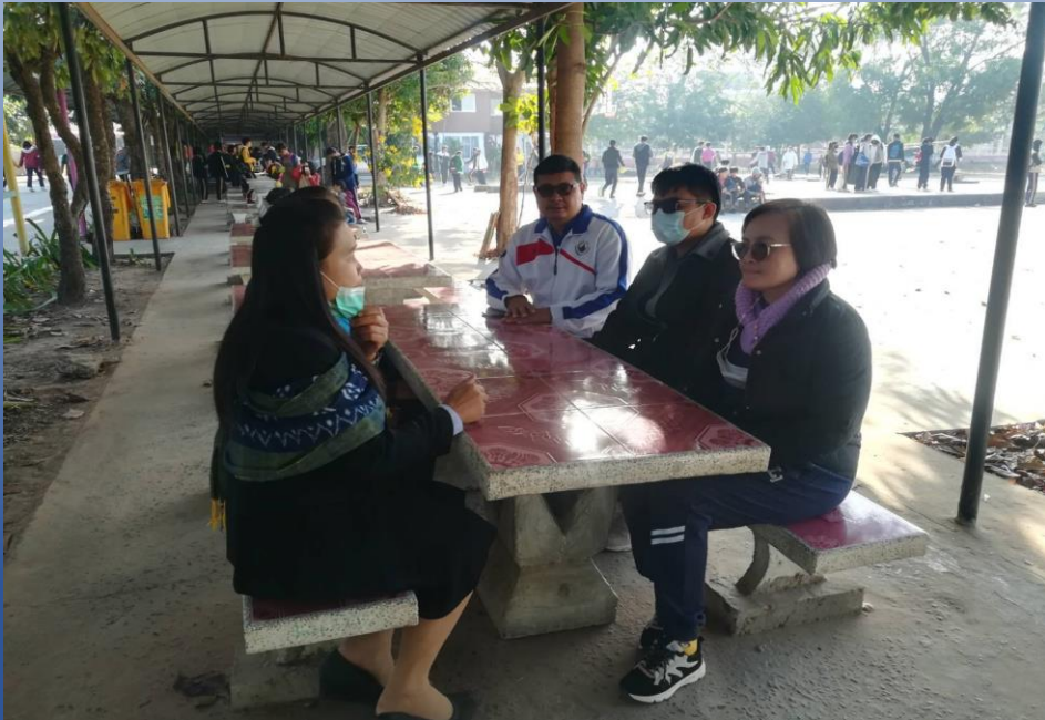
แลกเปลี่ยนเรียนรู้PLCห้องเรียนทวิศึกษา