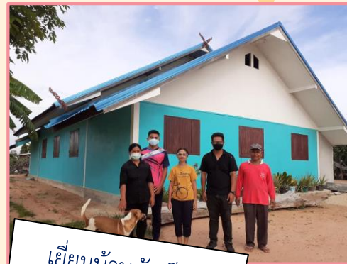
เยี่ยมบ้านนักเรียน