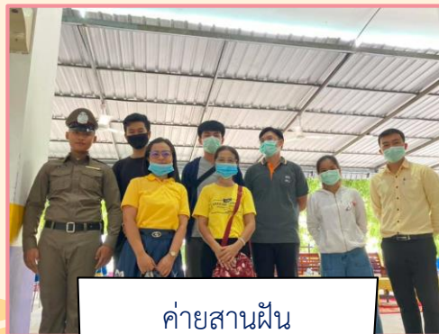
ค่ายสานฝัน