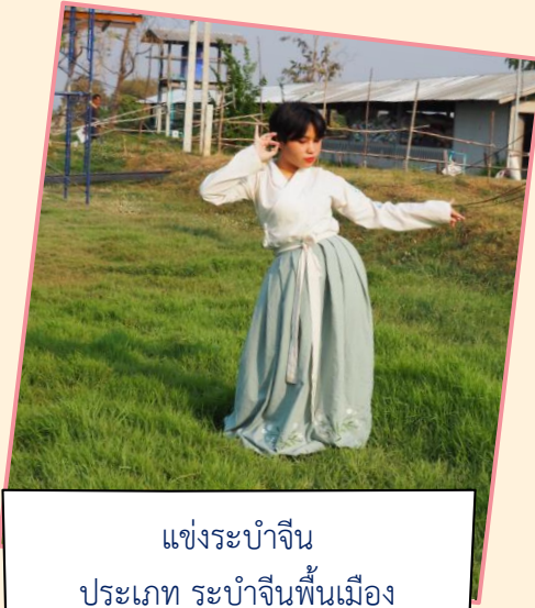
แข่งระบำจีน ประเภท ระบำจีนพื้นเมือง