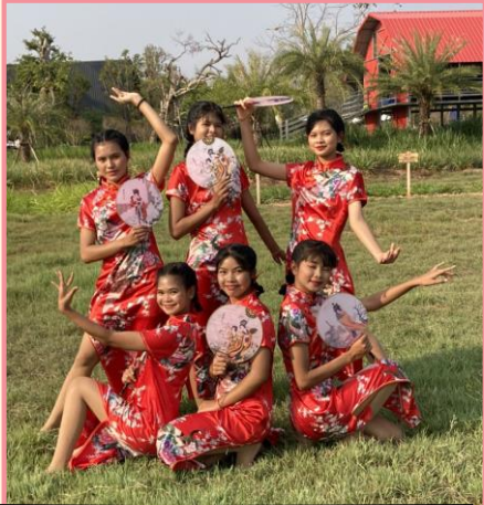
แข่งระบำจีน ประเภทระบำจีนคลาสสิก