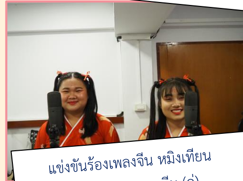
แข่งขันร้องเพลงจีน หมิงเทียน หนี่ท้าว ประเภททีม (คู่)