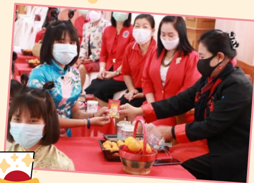
กิจกรรมส่งเสริมการเรียนรู้วัฒนธรรมจีน (วันตรุษจีน)