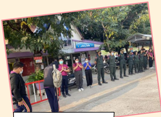
ครูเวรประจำวัน