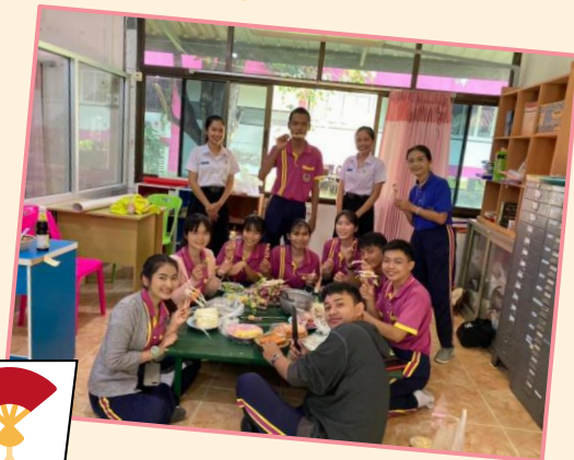
กิจกรรมการสอนชุมชนภาษาและวัฒนธรรมจีน