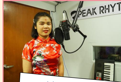
แข่งร้องเพลงจีน เวย เวย ประเภทเดี่ยว