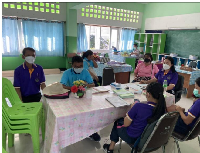
กิจกรรม PLC-5 แบบบันทึกการประเมินผล / สะท้อนการจัดการเรียนรู้ / กิจกรรม / นวัตกรรม