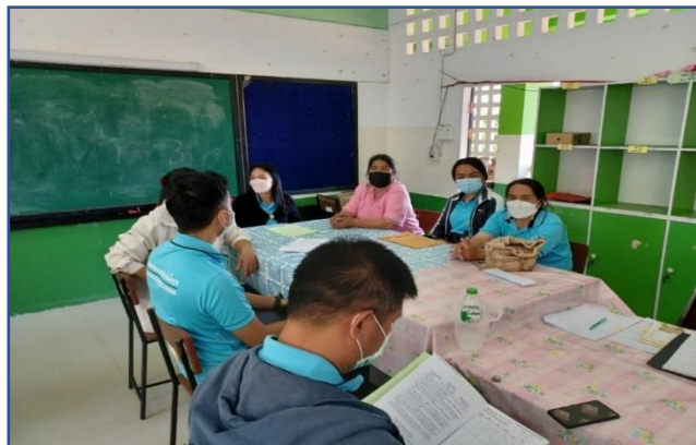
กิจกรรม PLC-2 การค้นหาปัญหา วิเคราะห์ สิ่งที่ต้องการพัฒนา