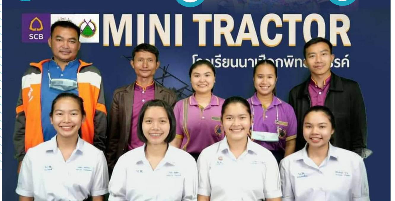
สิ่งประดิษฐ์เพื่อชุมชนในโครงการกล้าใหม่ไฟรั้ สิ่งประดิษฐ์เพื่อชุมชนในโครงการกล้าใหม่ไฟรั้ สิ่งประดิษฐ์เพื่อชุมชนในโครงการกล้าใหม่ไฟรั้