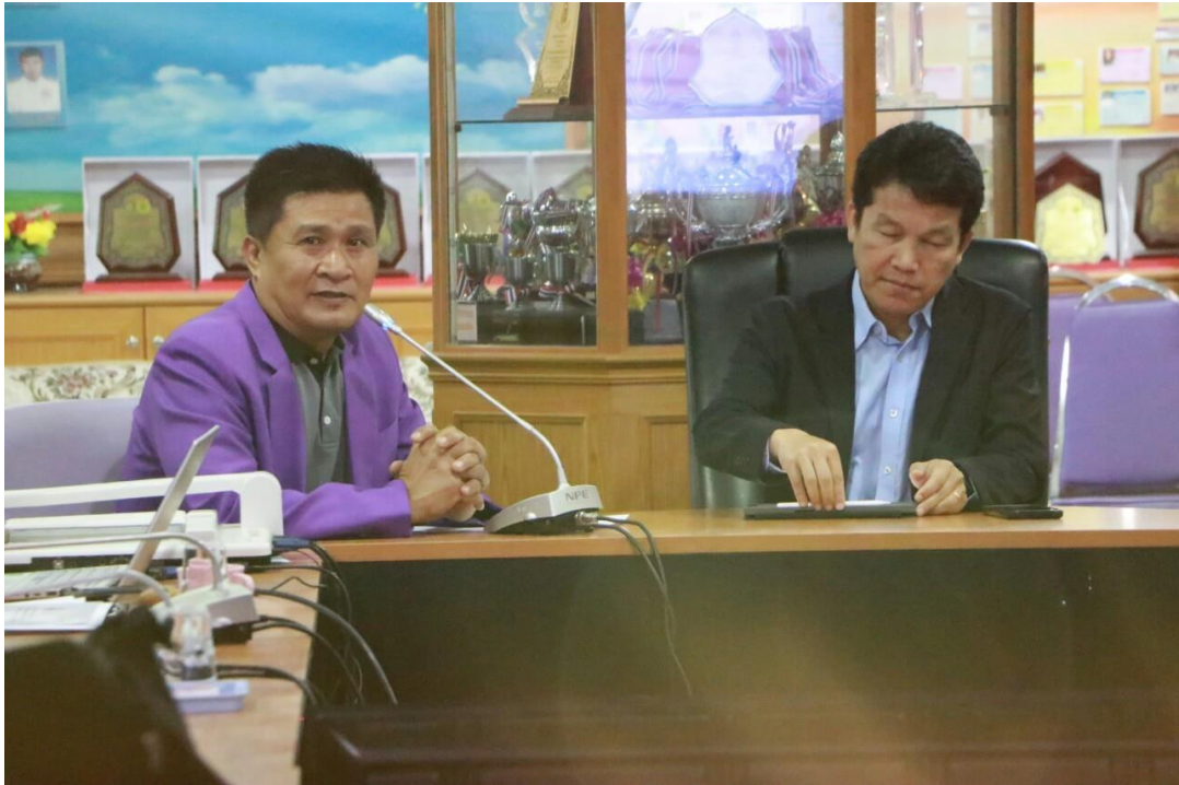
รับการติดตามกิจกรรม PLC จากผู้เชี่ยวชาญครูสภา