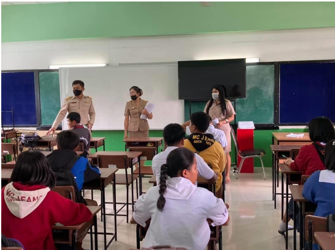
การนิเทศชั้นเรียนร่วมกับผู้บริหาร