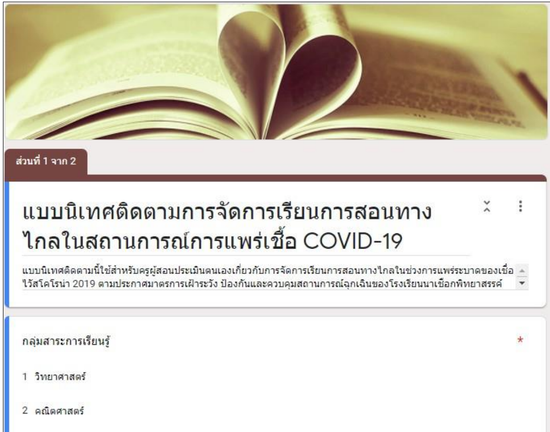
จัดทำแบบนิเทศการเรียนการสอนทางไกลแบบออนไลน์