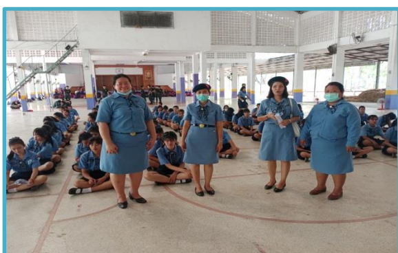
ครูผู้สอนนักเรียนกิจกรรมบำเพ็ญประโยชน์ ม.5