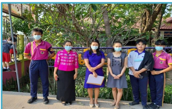
ปฏิบัติหน้าที่เวรประจำวันพฤหัสบดี ยืนเวรประตู หน้าอาคารสุจิน