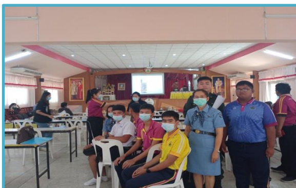
อบรมเชิงปฏิบัติการทำหนังสือเกี่ยวกับบ้านฉัน ที่นาเชือก กิจกรรมบริการชุมชน (ระยะที่ 1)