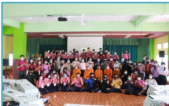
อบรมเชิงปฏิบัติการทำหนังสือเกี่ยวกับบ้านฉัน ที่นาเชือก กิจกรรมบริการชุมชน (ระยะที่ 1)