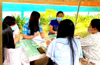
ร่วมกิจกรรมแห่งการเรียนรู้ทางวิชาชีพ (PLC) ระดับชั้นมัธยมศึกษาปีที่ 4