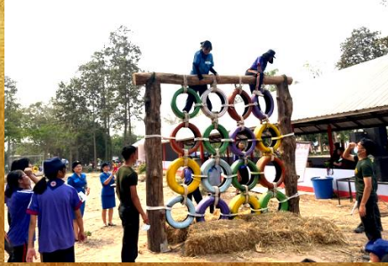
กิจกรรมเข้าค่ายลูกเสือภาค ประจำปี 2563