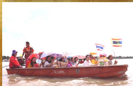
งานทอดผ้าป่าทางน้ำ เกาะโนนช้าง อ่างห้วยค้อ อ.นาเชือก