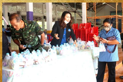
ประชุมผู้ปกครอง ประจำภาคเรียนที่ 2/ 2563