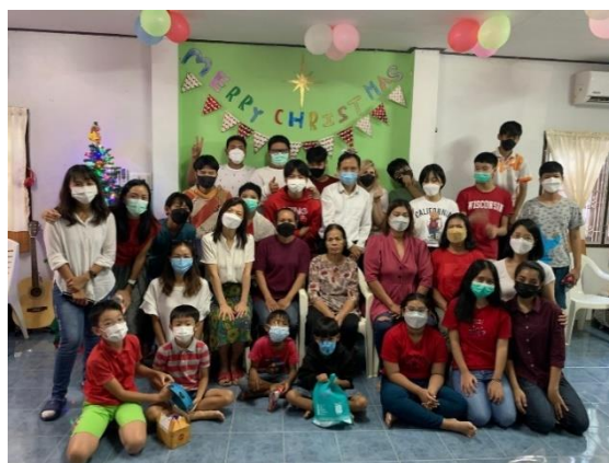
學生群體穩健成長(30人)